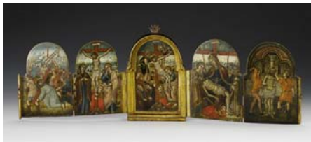
1133 WESTRUSSISCHE SCHULE 17. JH.

Zuschlag (inkl. Aufgeld) CHF 82'700 | EUR 51'688 | USD 82'700