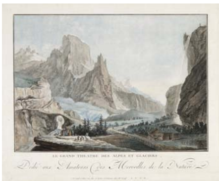
2069 CASPAR WOLF Muri (AG) 1735-1783 Heidelberg