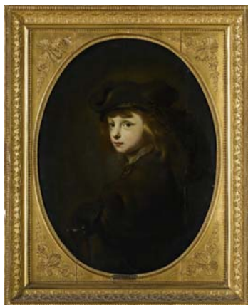
1090 JACOB ADRIAENSZ BACKER Harlingen 1608-1651 Amsterdam