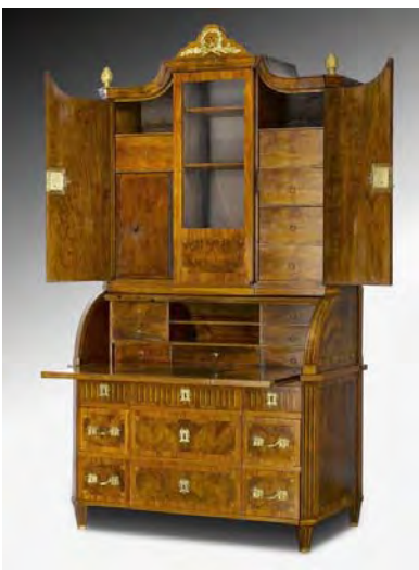
3605 Louis-XVI.-Aufsatzschreibkommode, Johannes Aebersold, Bern, Ende 18. Jh.

Die Kommode stammt aus der östlichen Umgebung von Paris oder aus der Gegend von Nancy.