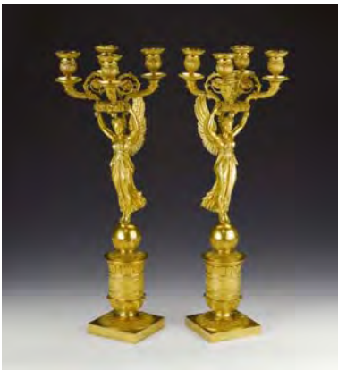
3782 Ein Paar Spätempire-Kandelaber, Frankreich, um 1820

CHF 35'000/40'000 EUR 22'000/25'200 USD 32'300/36'900