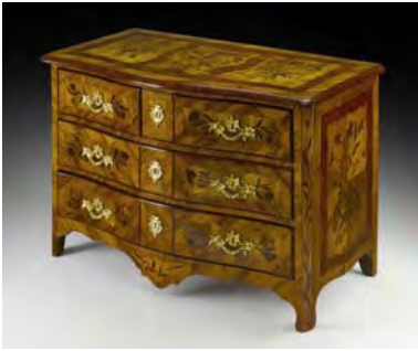
3568 Barockkommode, Frankreich, Mitte 18. Jh.

Nussbaum- und Zwetschgenholz. Allseitig mit floralen Ziermotiven sehr reich und in vorzüglicher Qualität eingelegt. Vergoldete Bronzebeschläge. 84,5 x 119 x 63 cm