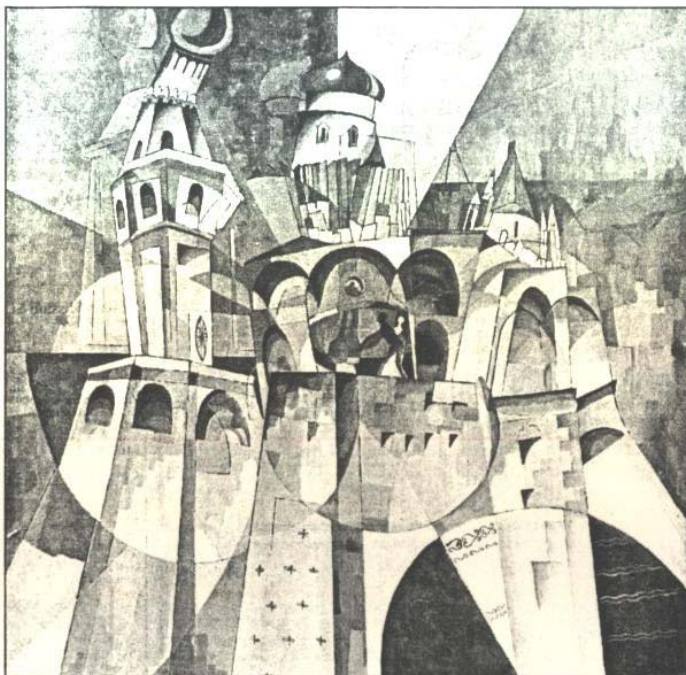
Den Einstieg in die Ausstellung «Osteuropäische Avantgarde», welche die Galerie Fischer bis 9. September in ihren Räumen präsentiert, bildet die Ende der 20er Jahre datierte Gouache «Kathedralen in Moskau» des Kubisten Aristarch Lentulow. Provenienz: Sammlung Rubinstein, Moskau.

Wie unterschiedlich der Begriff «Abstraktion» interpretiert wurde, das zeigen auch die Werke der hier